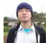
現代美術家 荒井信吉 Shinkichi ARAI