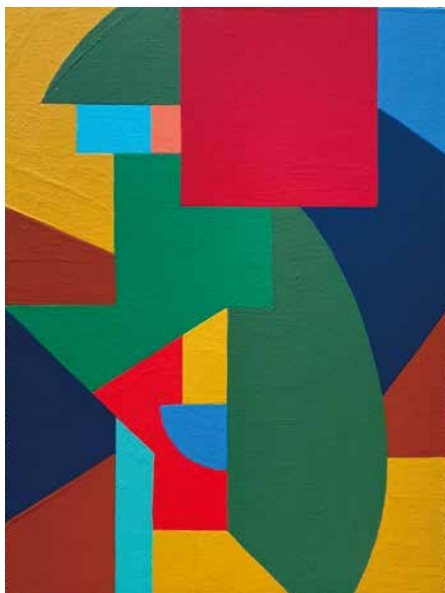
野原一郎「園丁-夏-2021」アクリル、キャンバス (72×53 cm)